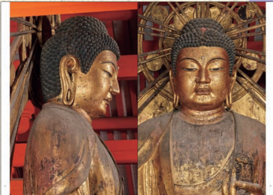
阿弥陀如来像(兵庫 浄土寺)