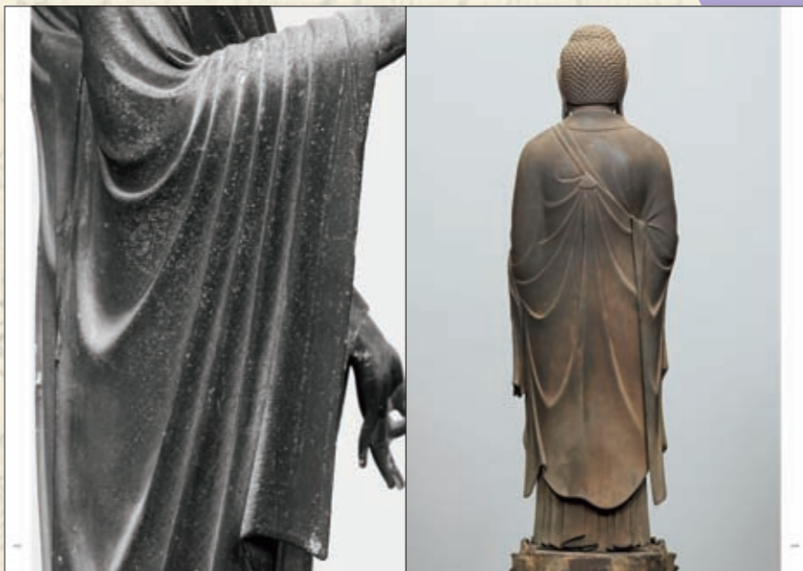
阿弥陀如来像(奈良 西方寺)