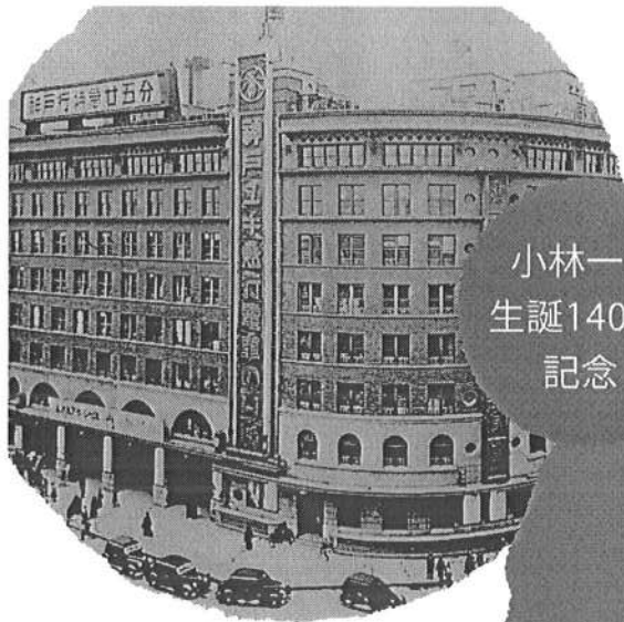
昭和29年当時の 阪急百貨店 梅田本店外観