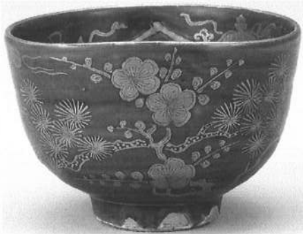
金欄手松竹梅茶碗 (永楽保全)

2012年春期に開催された逸翁美術館特別展覧会の展示図録。逸翁(小林一三)は、三井銀行を退社し、箕面有馬電気軌道(後の阪急電鉄)を起業した40年代前半頃、茶道の師となる表千家の生形貴一宗匠と出会い、本格的に茶人としての道を歩み始めることになる。茶の湯との出会いや、近代数奇者としての歩みを、残された茶会記をひもときながらオールカラーでたどる。