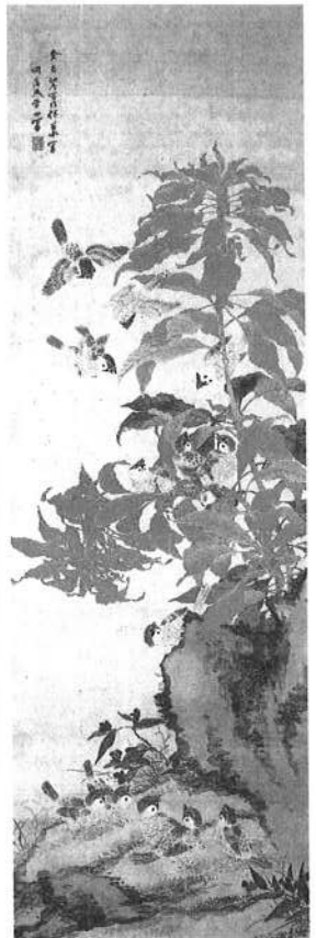
『雁来紅群雀図』大分市美術館