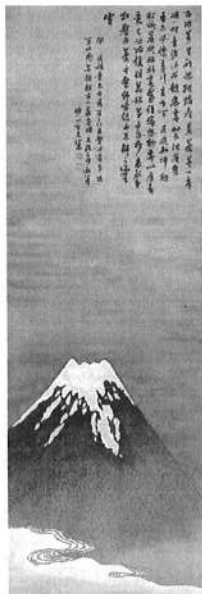
『芙蓉残雪図』大分市美術館