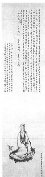
『白衣大士図』大分県立芸術会館