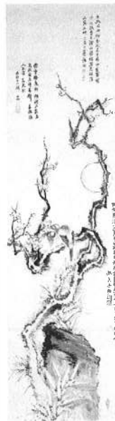
『梅花宿鳥図』大分県立芸術会館