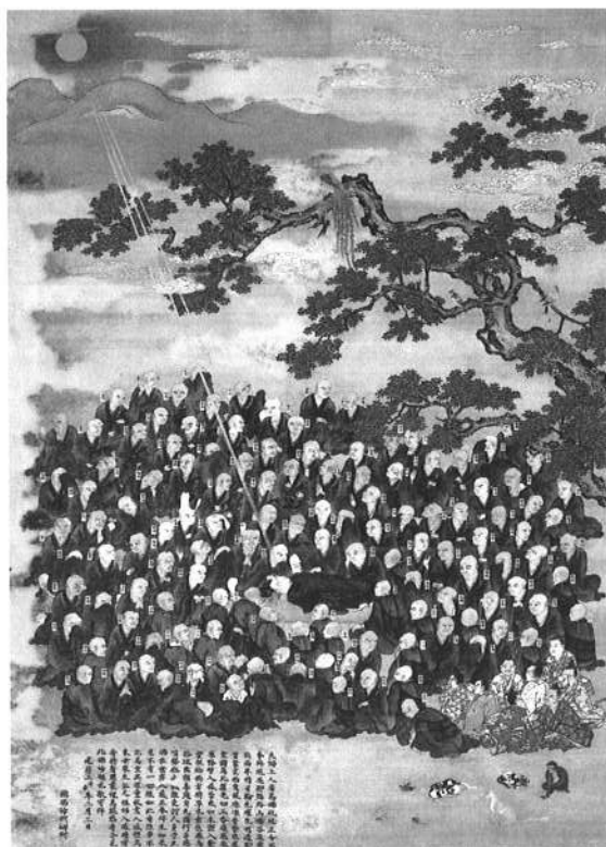
法然上人涅槃図 江戸時代

法然上人の『一枚起請文』をはじめ、日本浄土教の祖師である恵心僧都が描いたとされる「山越阿弥陀図」「地獄極楽図」や彫刻したとされる「鑿おさめ如来」、玄奘訳『称赞浄土仏摂受経』などいづれも学界、宗教界に寄与するものばかり。