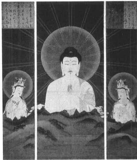
山越阿弥陀図屏風（伝恵心僧都）鎌倉時代