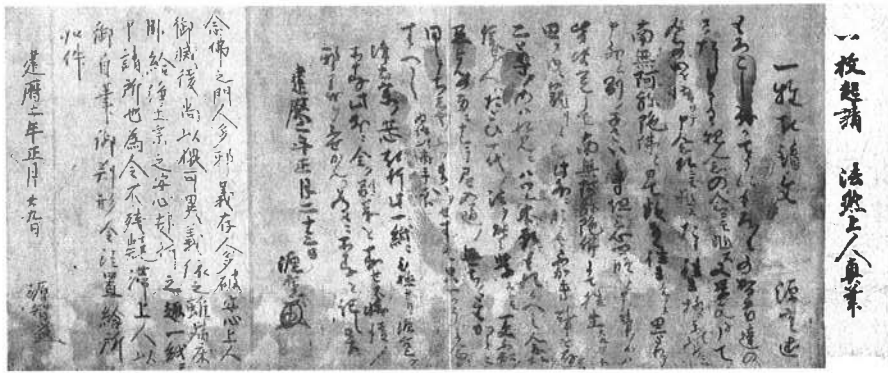
一枚起請文（法然上人）鎌倉時代