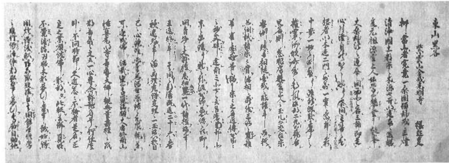
東山黒谷紫雲山金戒光明寺縁起（道残上人）安土桃山時代