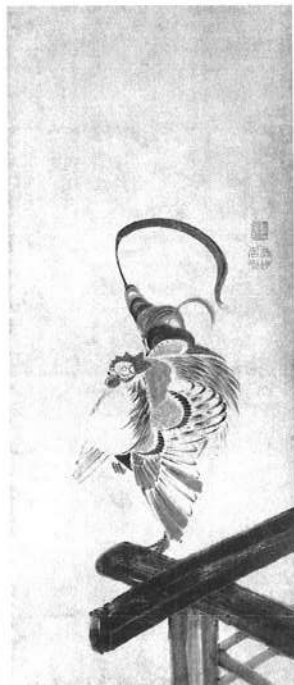
鶏図 伊藤若冲（部分）江戸時代