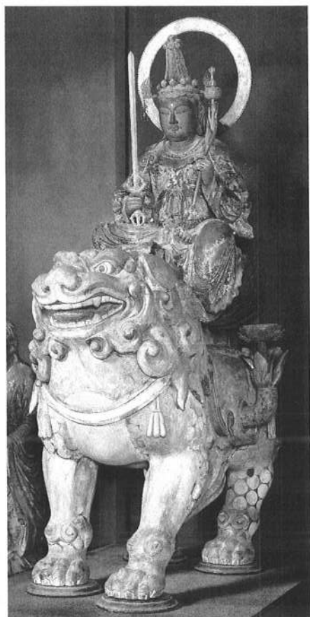
文殊菩薩半伽像 (中山文殊 鎌倉時代)

約五七〇点の宝物全点をFMスクリーン高精細印刷による、オールカラーの大型図版で後世に残す。