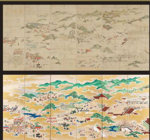
「月次祭礼図屏風」の復元と研究 ◆よみがえる室町京都のかがやき

愛知県立芸術大学を中心に、日本画、美術史、文献史学など多方面の専門家の協働により学際的に原資料の復元が試みられ、その過程でさまざまな新知見が得られた。ペールに包まれた室町時代の京都に光をあてる画期的プロジェクトの成果を公開。